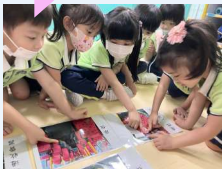
幼兒觀察普通座位及關愛座的分別