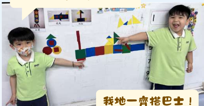
我地砌左架好長嘅船啊！