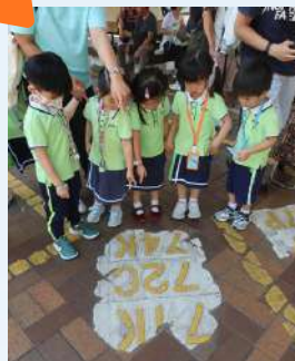
按地下的指示 找出巴士站的位置