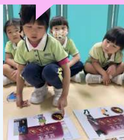
認識需要關愛座的人士