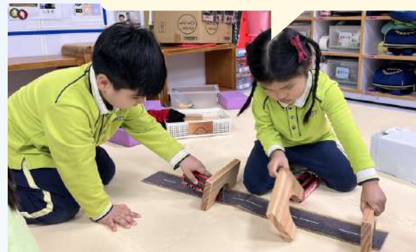
呢到有有三個細隧道比車過。