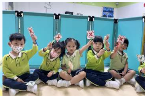
一同想想圖卡中的哥哥/姐姐是否正確