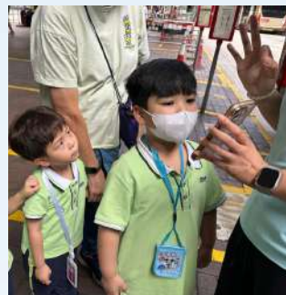
瀏覽KMB APP 閱讀巴士到站時間