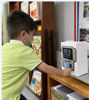
學習使用八達通付款