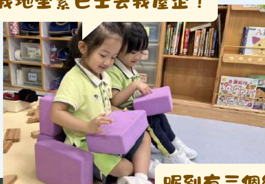
我地坐緊巴士去我屋企！