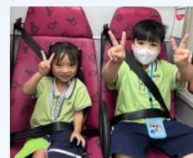
2. 扣好安全帶坐定定