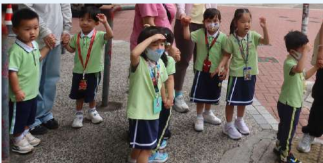
一同左望望，右望望，無車先好過