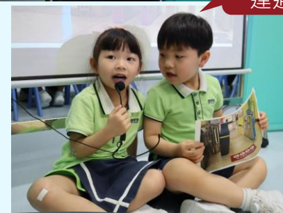
幼兒二人討論圖卡上設施的用途