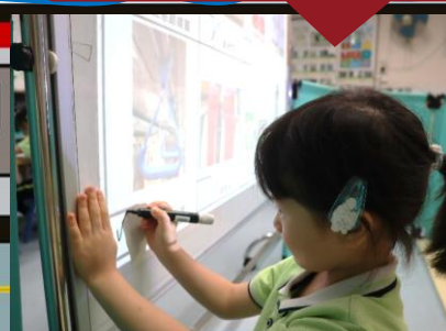
幼兒二人討論車廂設施並完成記錄表