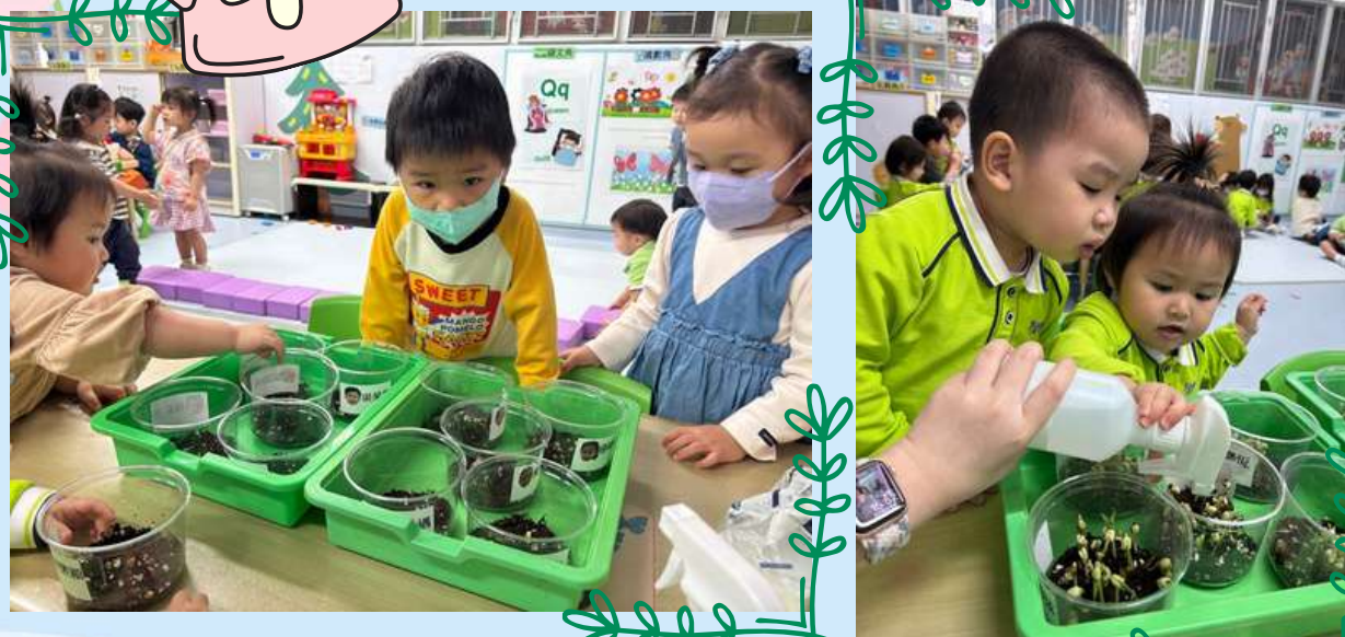
幼兒觀察自己的小綠豆及為其澆水