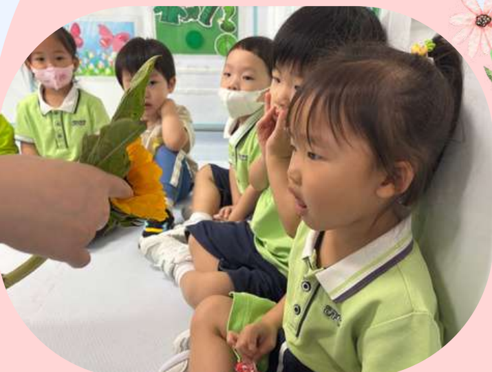
看一看花的外觀和顏色