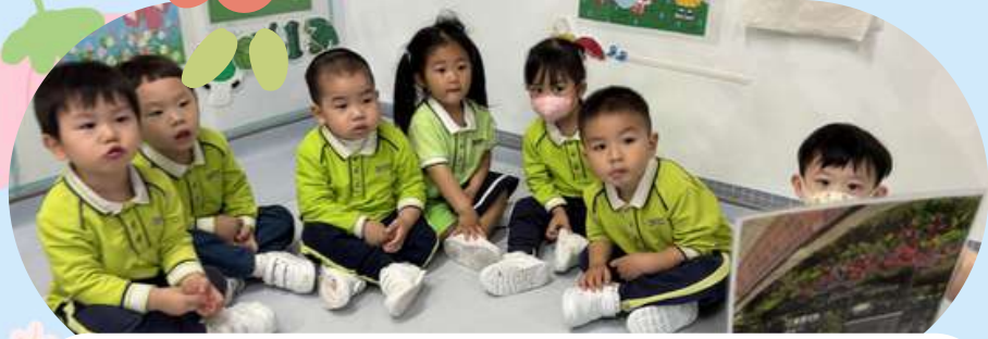
觀察寶雅苑公園的植物照片