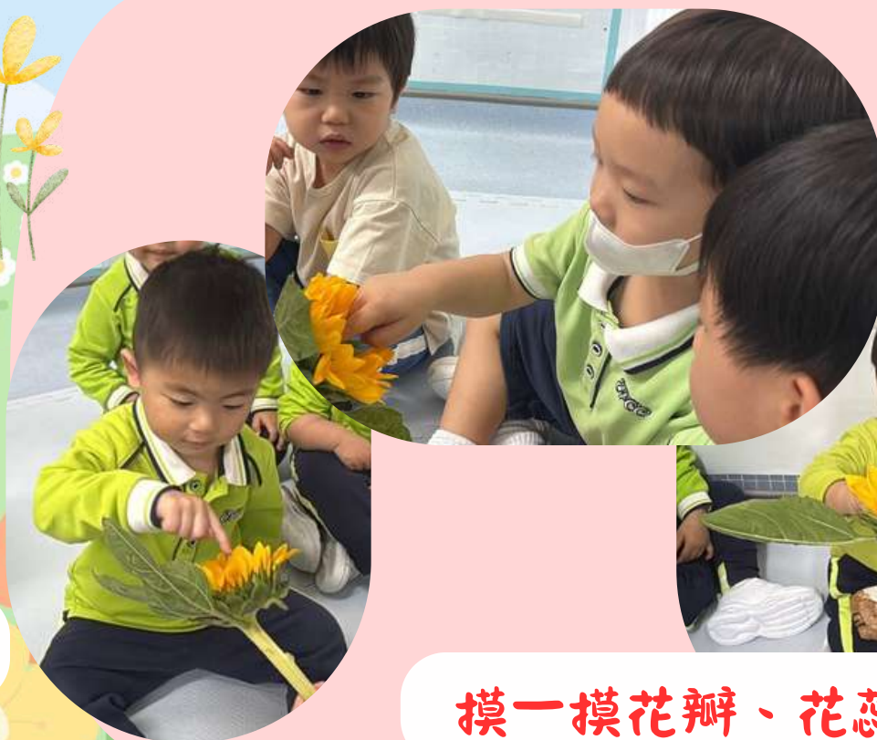
摸一摸花瓣、花蕊、葉子和莖的質感