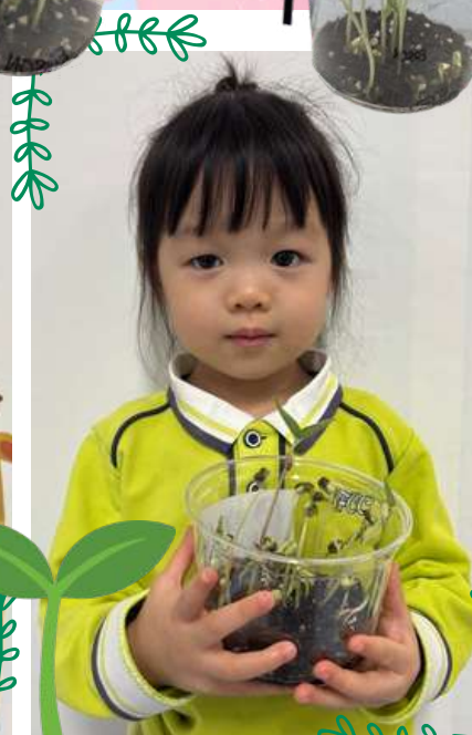
小綠豆漸漸開始發芽，甚至越長越高～