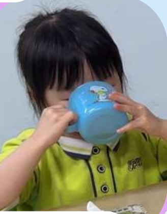
品嚐蜜糖水的味道