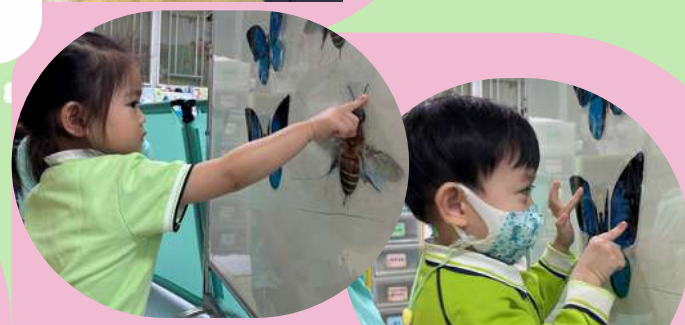
指出蜜蜂和蝴蝶的身體部位