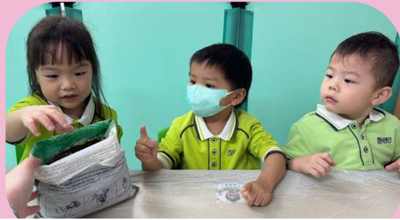
看一看、摸一摸泥土的顏色和質感