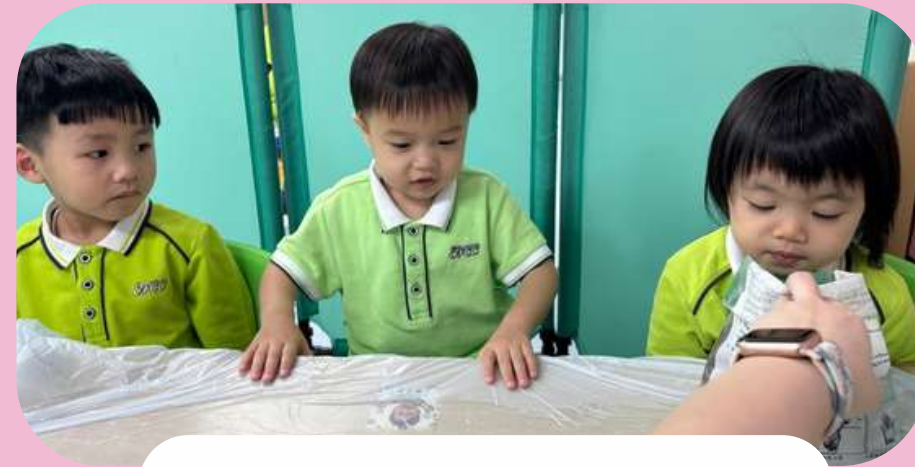
嗅一嗅泥土的氣味