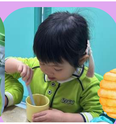
加入室溫水後用匙羹拌勻