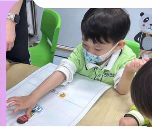
投票選出對蜜糖水的感覺