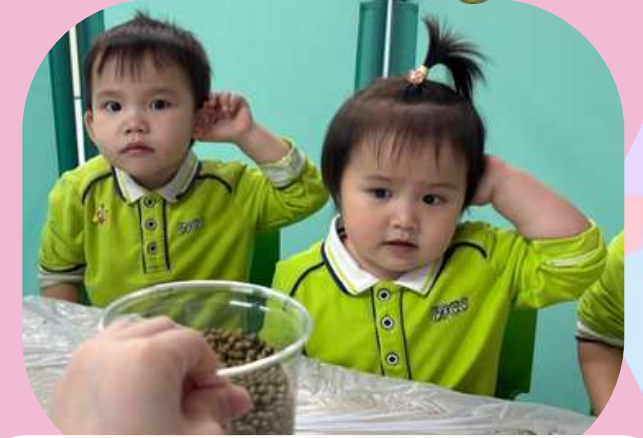
聽一聽綠豆的聲音