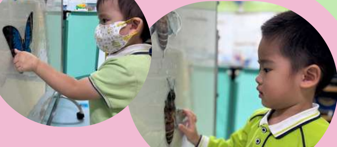
拼出蜜蜂和蝴蝶的身體結構