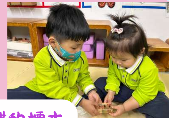
觀察蜜蜂和蝴蝶的標本