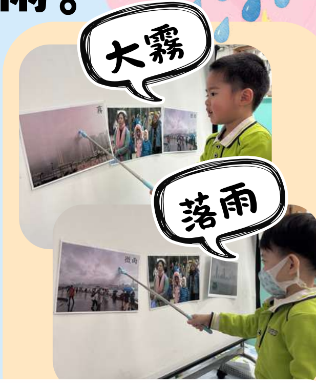
透過觀察天氣報告短片和真實圖片認識下毛毛雨和出現大霧的現象