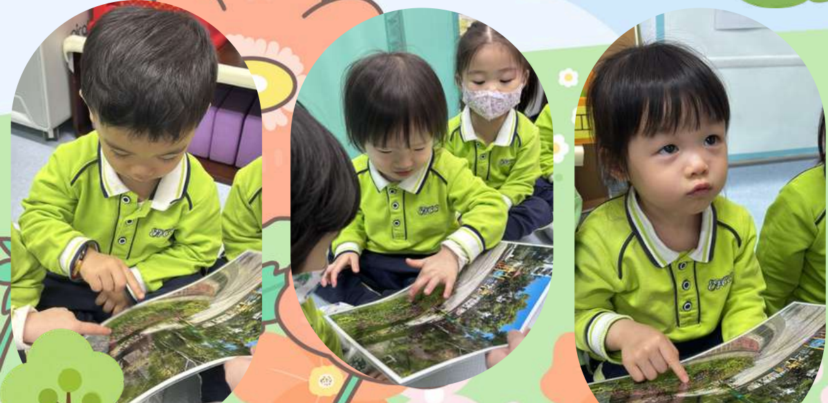
指出花園中的花朵、小草和樹木