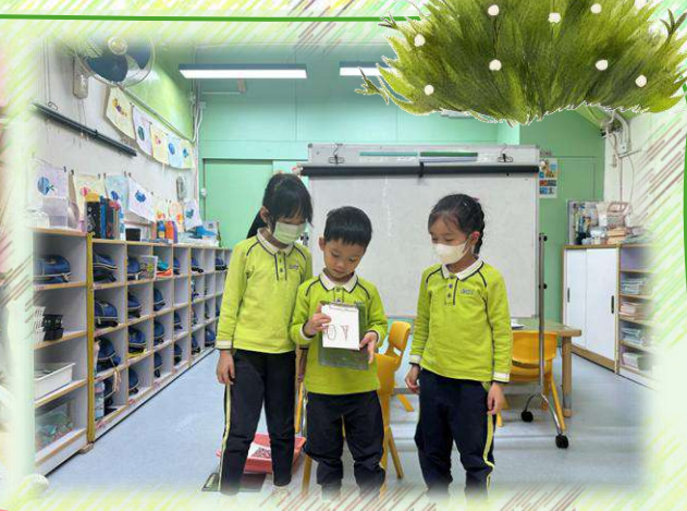
3 最後，小組輪流分享搜集到的樹木名稱和觀察比較結果。