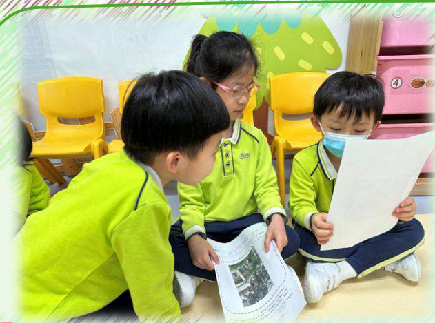
1 幼兒二至三人一組，首先與同伴分享工作紙中所搜集的內容一樹木的名稱和特徵。

老師請幼兒與家長在社區中尋找及觀察一棵喜歡或特別的大樹，並在主題工作紙上進行記錄，然後回校透過同伴之間的分享，認識不同的樹木種類和特徵。以及透過小故事延伸出喬木和灌木的特徵，並學習喬木和灌木。