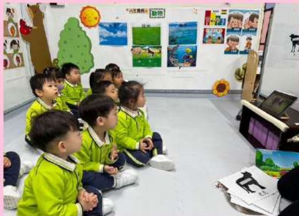
3. 透過影片，觀察陸上動物的行走方式。