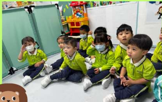
1. 與幼兒聽辨動物叫聲。

老師先播放動物的聲音，讓幼兒透過聲音辨認出是什麼動物，然後選取動物的圖卡配對到相應的動物影子圖卡上。繼而觀察動物的影片，認識常見的四肢動物及知道動物的行走方式和活動地方。