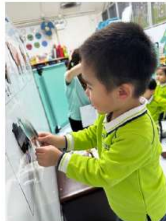
2. 聆聽聲音後，把相應的動物貼到動物的影子圖卡上。