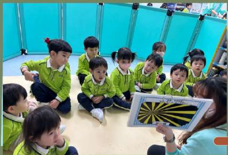
1. 幼兒正聆聽聖經故事影片「神造天地」。

主題以聖經故事「神創造天地」的影片和故事書展開，讓幼兒認識神為我們創造了天空、陸地、海洋、花草及動物等，再利用實物圖片讓幼兒分辨海、陸、空，以及辨認各種動物的名稱，並嘗試將各種動物擺放到牠們的活動地方。