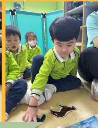
4. 幼兒取動物圖片，嘗試說出牠們的名稱，並放回動物的活動地方。