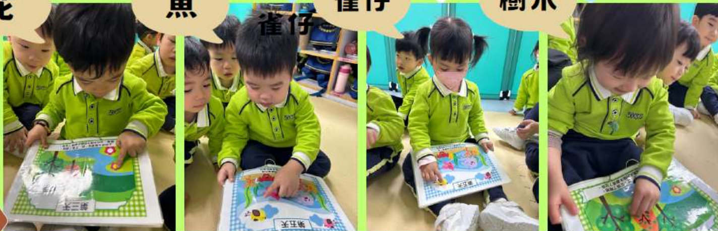
2. 幼兒透過觀察聖經故事書，指出在神所創造的世界裏最喜歡的東西，並嘗試說出物品名稱。