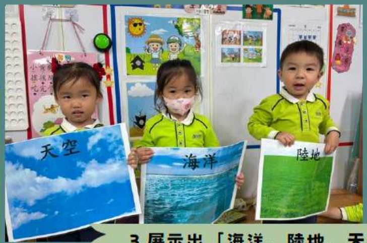
3. 展示出「海洋、陸地、天空」實物圖，讓幼兒觀察並認識各地方名稱。