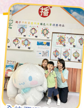
全校票選我最喜愛花燈設計第一名