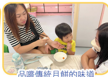
品嚐傳統月餅的味道