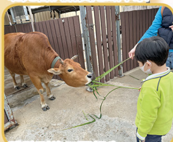
體驗到綠田園餵牛