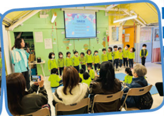
K3班幼兒表演兒歌 「均衡飲食」