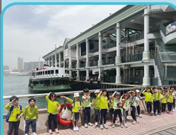
我們一起乘搭天星小輪