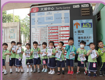
乘搭71K巴士前往大埔中心