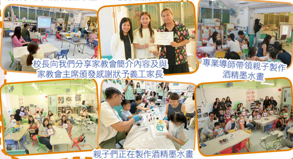
校長向我們分享家教會簡介內容及與家教會主席頒發感謝狀予義工家長

2025年5月24日舉行親子中華文化藝術工作坊暨家長教師會簡佈會，讓親子動手做酒精墨水畫，一起渡過愉快療癒的早上。