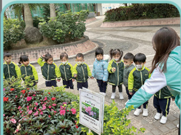
走到太和寶雅苑尋找花朵