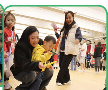
我和媽媽一同拋聖誕襪