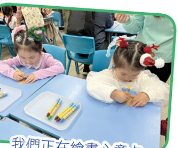
我們正在繪畫心意卡