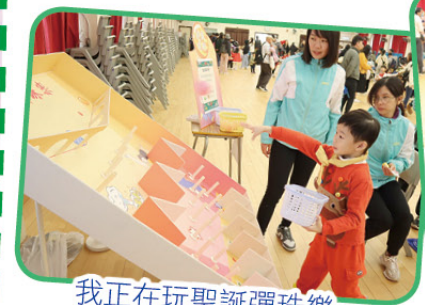
我正在玩聖誕彈珠樂