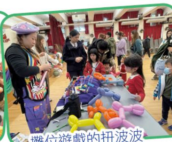
攤位遊戲的扭波波