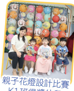
親子花燈設計比賽 K1班得獎幼兒