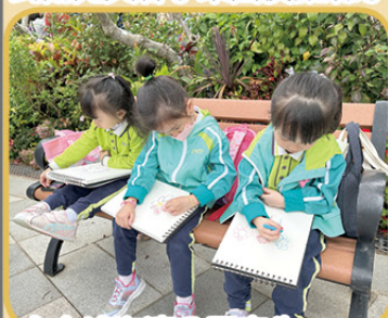
去大埔海濱公園寫生