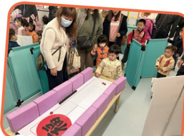
我們在玩冰壺接福奇趣樂