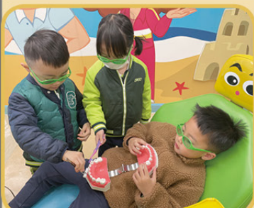
到陽光笑容小樂園模擬刷牙