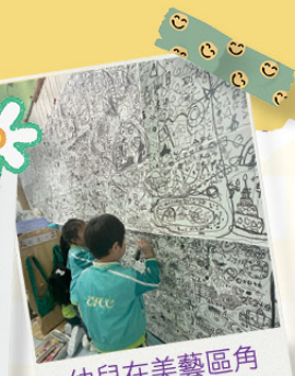
幼兒在美藝區角的創作