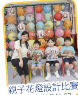
親子花燈設計比賽 K3班得獎幼兒