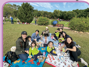
海濱公園野餐真開心