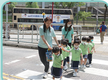
老師帶領幼兒過馬路