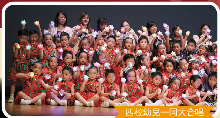
四校幼兒一同大合唱