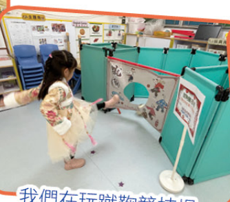
我們在玩蹴鞠競技場