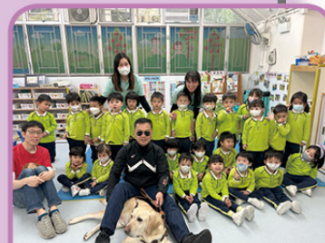
認識導盲犬的工作