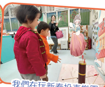
我們在玩新春投壺樂園