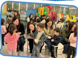
K1班幼兒與家長 分享自製爆谷