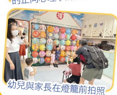
幼兒與家長在燈籠前拍照