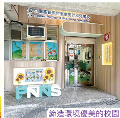
締造環境優美的校園

學校持續優化教學及學習環境，本年度暑假將會更換全校的燈飾及進行大堂翻新工程，期望締造更美好的學習環境給予幼兒成長及發展！