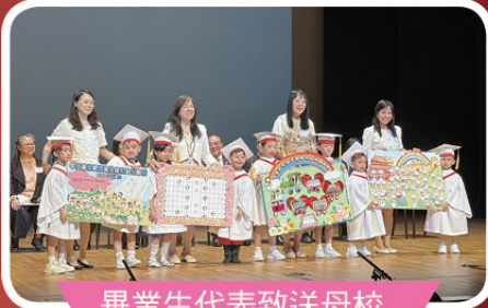
畢業生代表致送母校 紀念品給母校