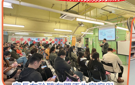
家長在聆聽有關原生家庭與 管教的講座

2025年1月25日本校舉行「親子新春市集暨家長講座」，幼兒與家長一同參與攤位遊戲、年花欣賞、於新春拍攝區拍照及品嚐中國傳統小吃。