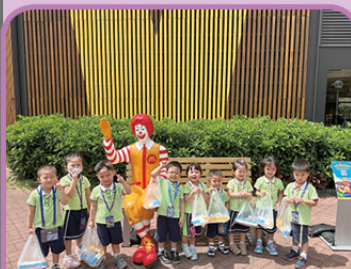
一起去購買美味的熱香餅