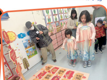
我們在玩迎春套圈大挑戰