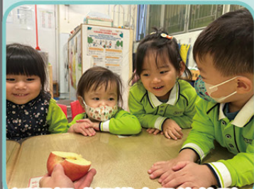
透過觸感認識水果的外型