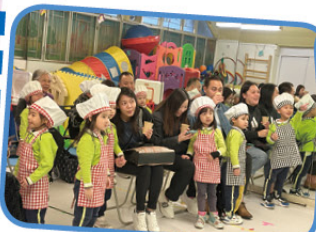
K2班幼兒與家長一同 觀看上課片段