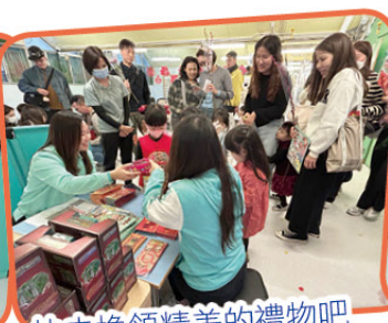
快去換領精美的禮物吧