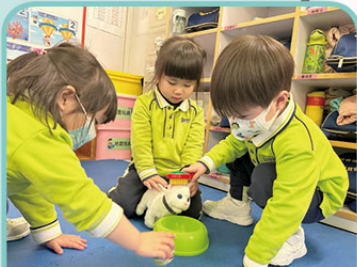
做個好主人，細心照顧小動物