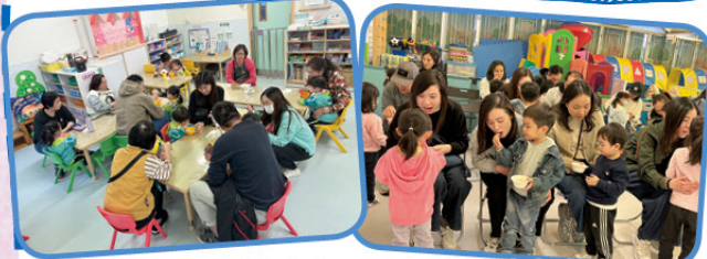
N1班家長們陪伴幼兒 進食茶點