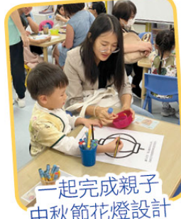
一起完成親子中秋節花燈設計