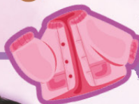
半立體作品：《漂亮的外套》