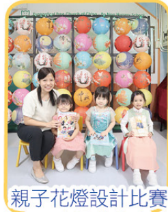
親子花燈設計比賽 K2班得獎幼兒