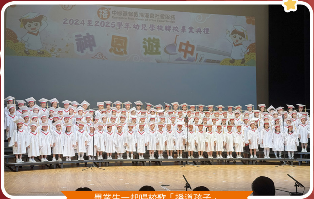
畢業生一起唱校歌「播道孩子」

2025年7月10日 於屯門大會堂演奏廳 舉行幼兒學校聯校畢業典禮，主題為「神恩遊『中』」。