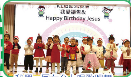
我們一同在台上唱歌跳舞

2024年12月21日順利舉行親子聖誕嘉年華，透過活動讓幼兒表演跳舞，進行攤位遊戲等，認識聖誕節的真正意義及中華文化。