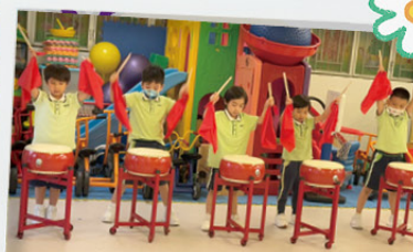
K3小朋友練習畢業典禮的表演

在教師方面，學校邀請了專業機構，為教師提供藝術培訓，有效提升教師認識不同藝術家背景、創作意念和技巧等，從而將有關的藝術元素加入班中的藝術活動中，實踐所學。此外，本年度舉行了四次「藝術大師班」活動，由專業導師到校進行示範教學，請