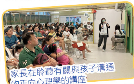
家長在聆聽有關與孩子溝通的正向心理學的講座

2024年9月14日舉行親子中秋慶祝會，活動包括：家長專題講座《正向心理學與孩子溝通元素》、燈籠拍攝區拍照、中秋圖工、冰皮月餅製作及品嚐傳統月餅。