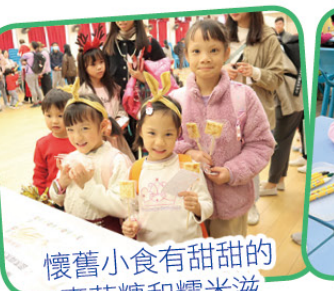
懷舊小食有甜甜的 麥芽糖和糯米滋