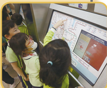
幼兒嘗試購買港鐵車票