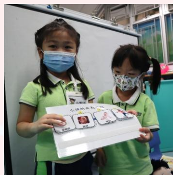
幼兒合作討論及排列小孩成長過程的圖卡， 並進行匯報。