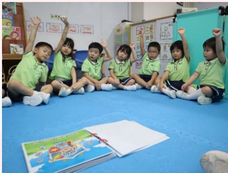
我們共讀故事 《守護身體小戰士》

我們的身體十分重要，需要好好的保護我們的健康。透過共讀故事《守護身體小戰士》，我們認識不同愛護身體的方法。我們又一起成為守護身體小戰士，以二人一組觀察情景圖，討論及辨別圖中人物有沒有保護身體，然後畫上✓或✕的符號。最後，我們進行匯報，分享情景圖正確或不正確的原因，並說出改善的方法。