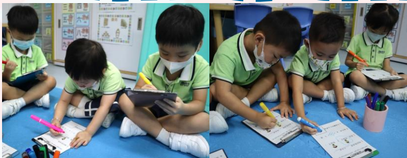
幼兒於記錄表記錄有關自己的資料