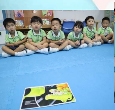
我們一起共讀繪本