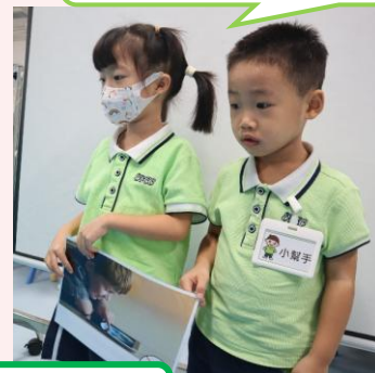
我們匯報討論結果