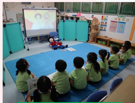
觀看短片後， 自行修正答案。

日常生活中，人與人之間會有不同的接觸。藉着二人一組觀察情景圖的人物行為，討論及分辨好的身體接觸和壞的身體接觸。學習到當遇到壞的身體接觸時，我們要勇於拒絕、離開現場，並告訴可信任的人。