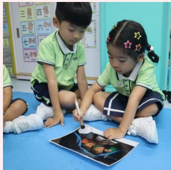
我們觀察及討論情景圖的內容