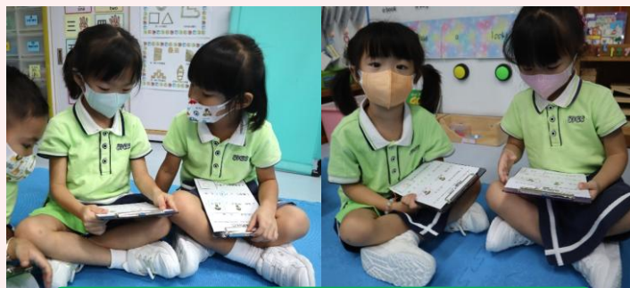
幼兒二人一組互相作自我介紹