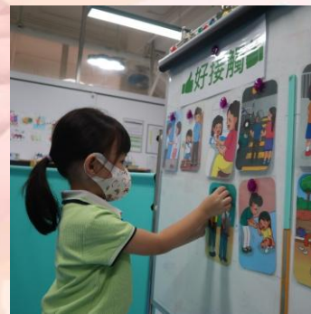
幼兒分享圖卡的人物行為，並分類為「好接 觸」或是「壞接觸」貼在白板上。