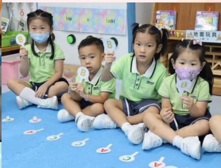
一起進行問答遊戲