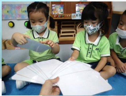
幼兒抽取情景圖，觀察及判斷圖片中的人物 行為是好接觸或是壞接觸